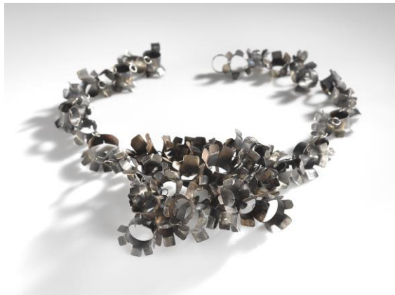
Sarah Ordoñez (City Goldsmith 2022) Aceitilla, 2022 Necklace: iron, silver Foto: Falko Behr

Die Landeshauptstadt Erfurt erwartet Bewerbungen bis zum 24. November 2024 in digitaler Form. Gebeten wird um die Einsendung einer aussagekräftigen Dokumentation des bisherigen Schaffens (max. 10 Seiten DIN A4 bzw. PPP-Folien; Bild und Text), eines Lebenslaufs und eines kurzen Anschreibens, aus dem die Motivation, ein solches Amt in Erfurt zu übernehmen, hervorgeht. Es gilt das Datum des Posteingangs im städtischen E-Mail-Konto.