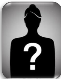
Verw. Prof. Dr. N.N.