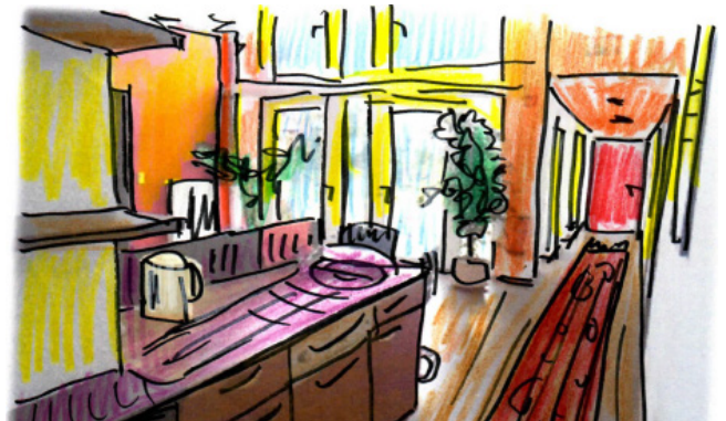
Skizze von G. Scheller nach einer Fotovorlage von C. Weik (2015: 35)

Anders schnitt dagegen die funktionale Einrichtung der Zimmer für die Nutzer*innen ab. Hier gelang es – so ergab die Analyse – die Geschmackspräferenzen der Klientel aufzugreifen, wozu auch die Möglichkeit, sich selbständig einzurichten, einen wesentlichen Beitrag leistete.